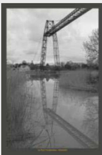
Une photo verticale